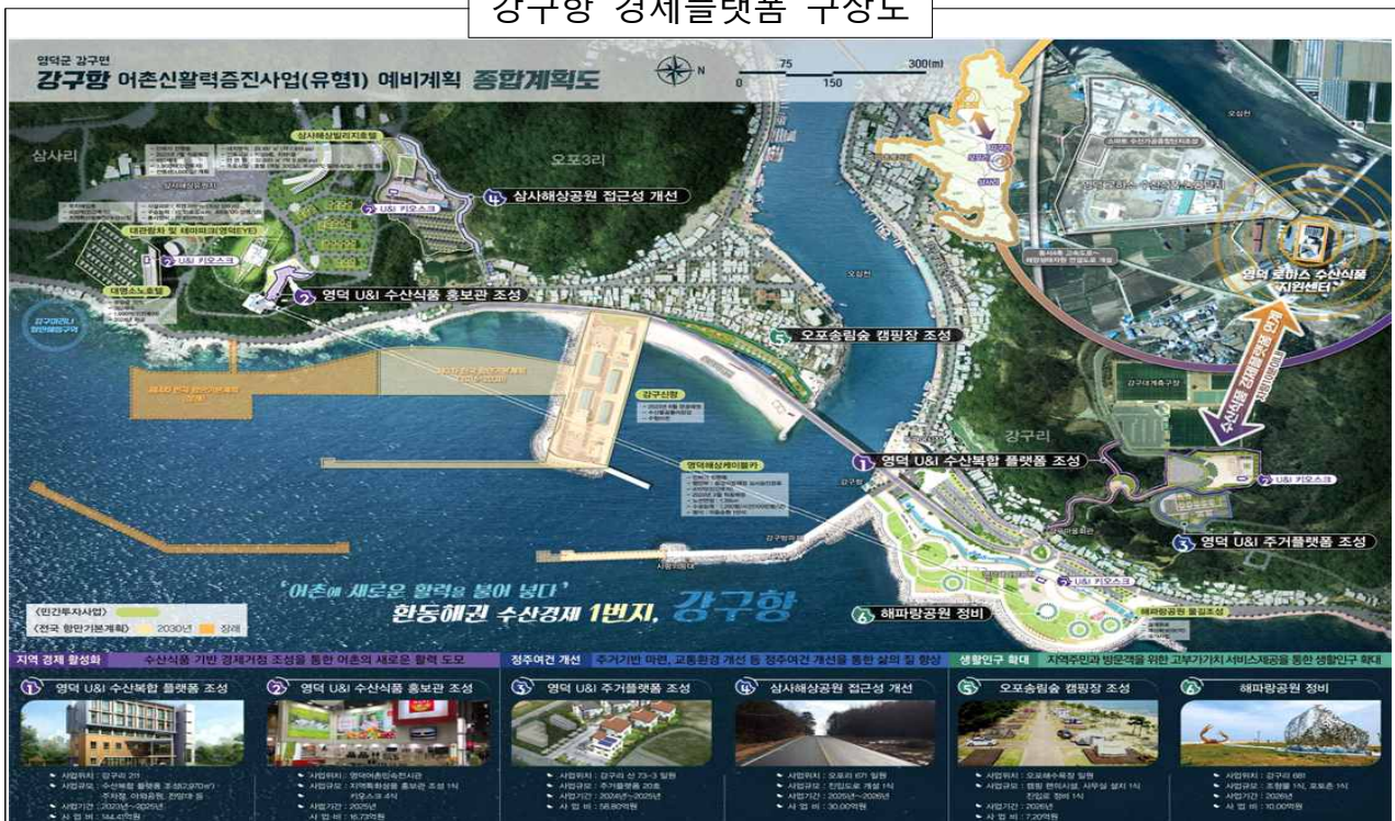
강구항 경제플랫폼 구상도

▶ 본 사업 추진을 통해 2026년까지 ① 신규 일자리 창출 1,600명, ② 수산업 전체 매출액 증가율 4%, ③ 정주만족도 75점 달성 등의 사업성과 전망